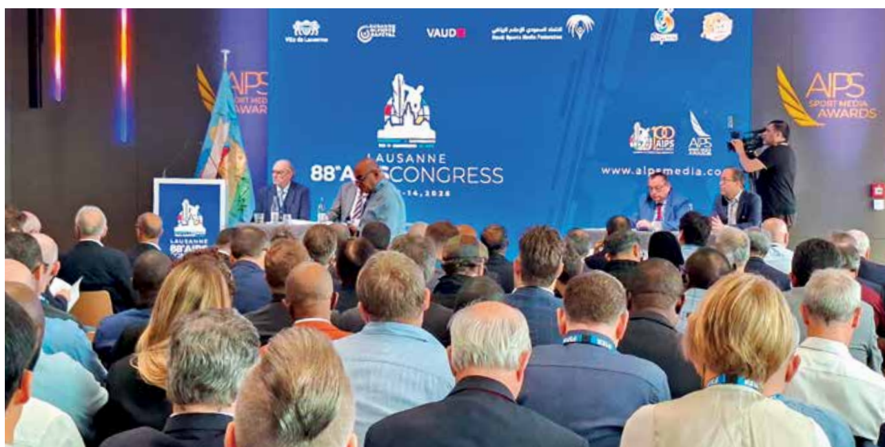
В преддверии выборов

два десятка лет. Но Джанни оказался опытным волком, и накопил за свою деятельность немало секретов в проведении электоральной компании, которые и пригодились ему, чтобы снова быть «коронованным» на очередной четырехлетний олимпийский цикл. А слово «олимпийский» на сей раз было особенно актуально, потому что вся предложенная для