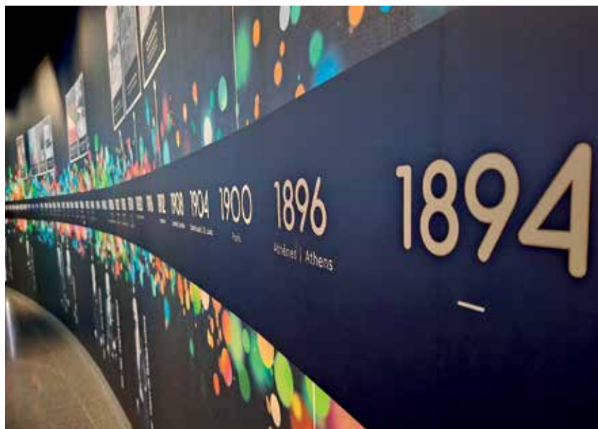
Экспозиция в музее МОК