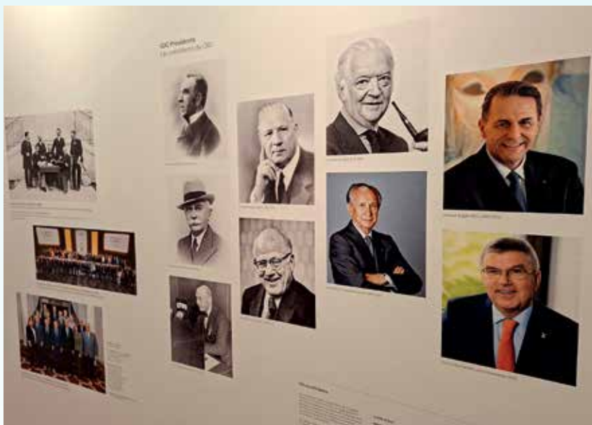
В олимпийском музее все президенты МОК

передислокация на автобусах FIFA в Лозанну — уже ближе к вечеру 220-километровый марш-бросок успешно завершился.