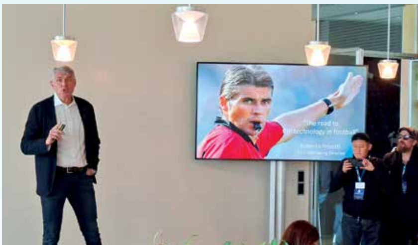
Глава департамента арбитража УЕФА Роберто Розетти