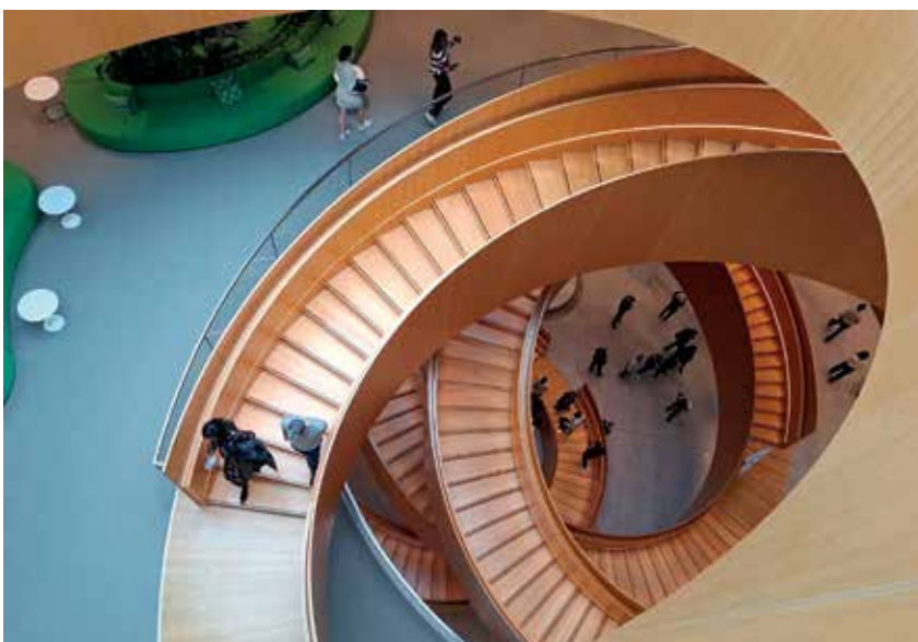
Крутая лестница в штаб-квартире МОК