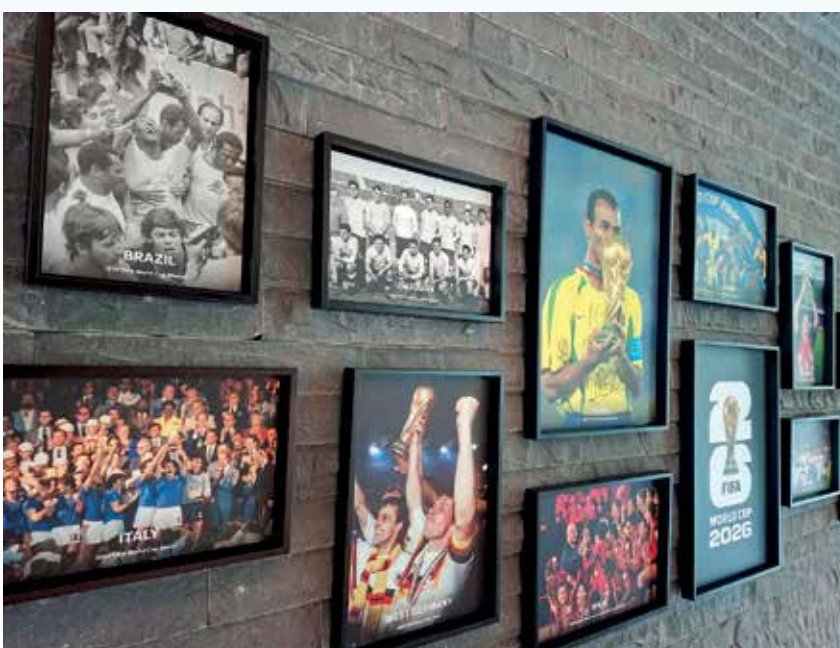
В фойе штаб-квартиры FIFA