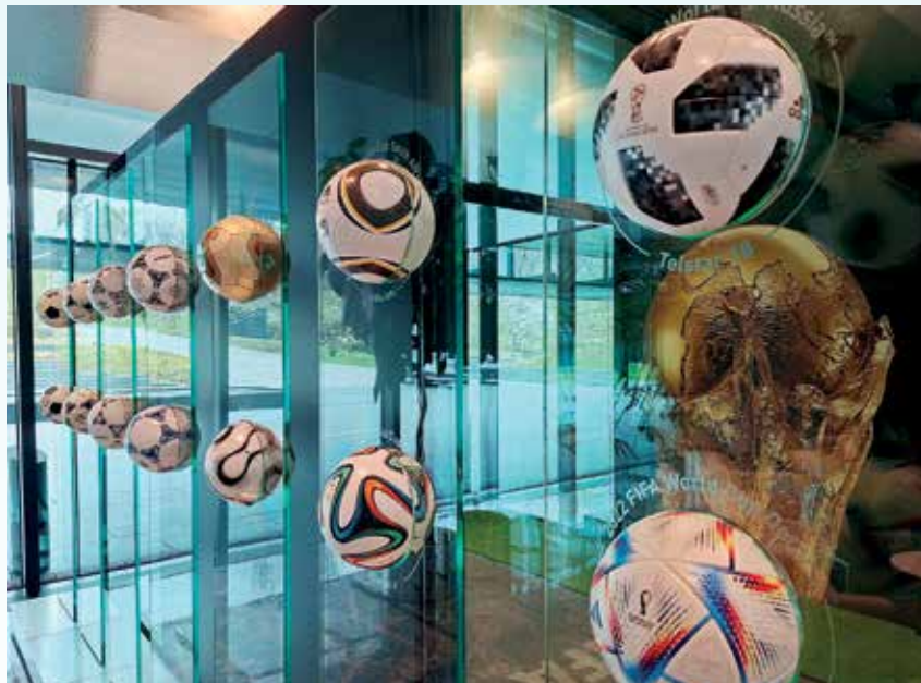
В фойе штаб-квартиры FIFA